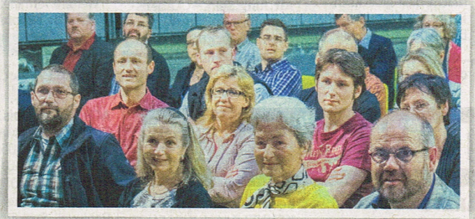
Enormes Interesse herrscht in Vorarlberg an der Landwirtschaft und an „gesunder“ Ernährungssicherheit.